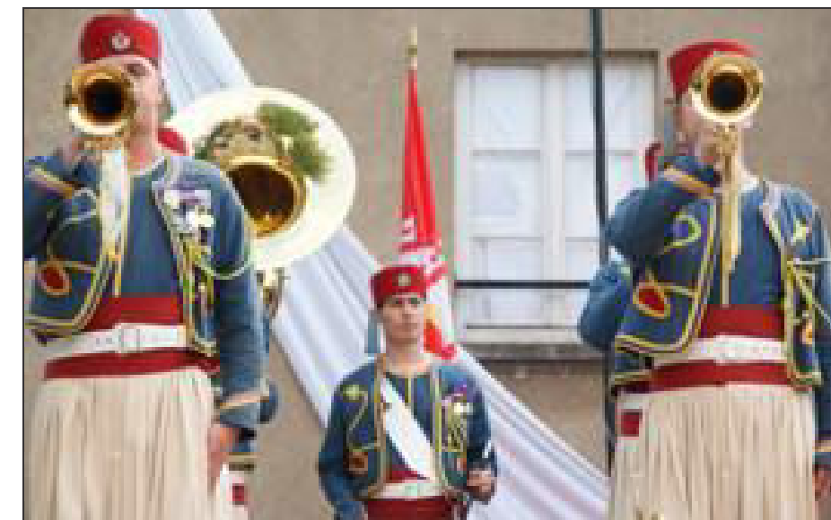
Grande tenue de la Nouba du 1er RT d'Épinal.