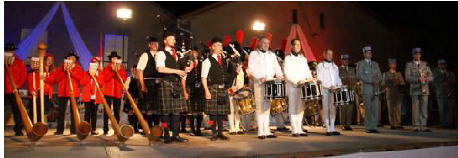
Tous ensemble sur scène, pour le final.